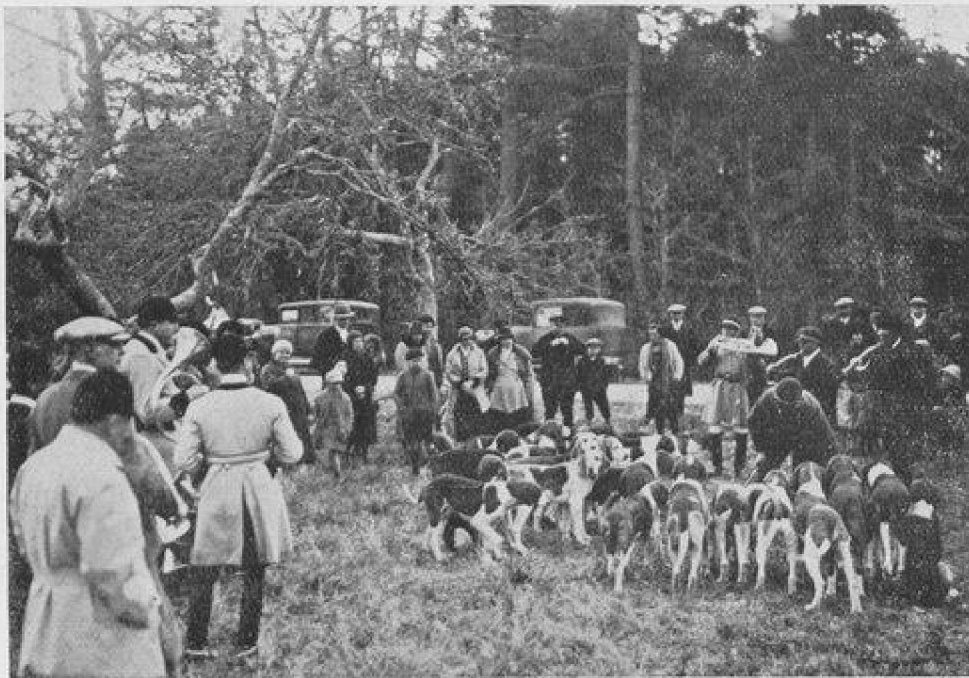
Curée aux cinq Chênes, forêt de Château la Vallière.

Il se compose de 45 à 50 chiens anglo-français, élevés pour la plupart au Chalet des Landes où se trouve le chenil. Ces chiens tirent leur origine de ceux de M. Perreau de Launay, en Vendée et de l'équipage de Resteau à M. le Comte Henri d'Andigné qui a couplé avec l'équipage en 1932.