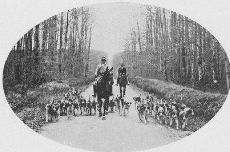
L'équipage de Champchevrier en forêt de Chinon.